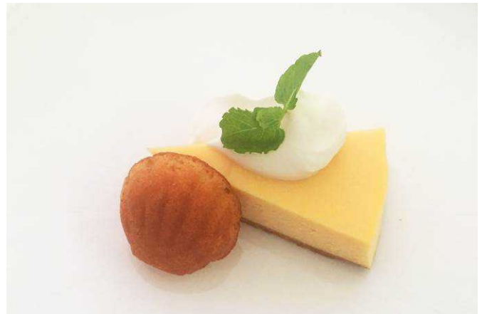
特製スイーツ(女王様のチーズケーキ)