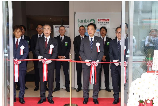
オープニングセレモニーの様子(8月1日実施)