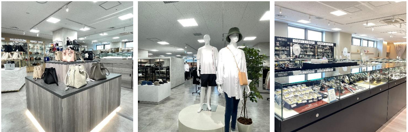
ファンビタウン2ビル内観

新ビルは、寺内として約30年ぶりの新館オープンとなり、堺筋に建ち並ぶファンビタウン1ビル、5ビルと合わせた3つのビル全体で売場を再構築、お客様が商品を探しやすいよう、同じアイテムをまとめるなど改善を行いました。人気のあるインポートブランドグッズやコスメ、ファッションブルな雑貨の売場面積を拡大し、品揃えの充実化を図り、売り場のイメージを高級感のある雰囲気にも一新しました。また各階に休憩スペースを設け、9階フロアには個室の授乳室を完備するなど、様々な年代のお客様が快適にショッピングを楽しめる工夫も行っています。