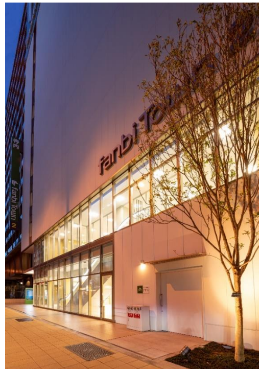
ファンビタウン2ビル外観