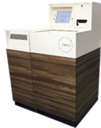
専用 BOX イメージ