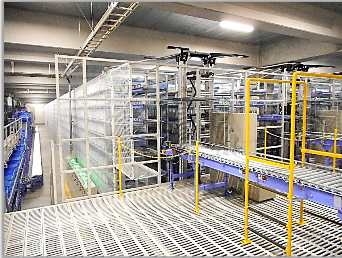
自動倉庫型ピッキングシステム